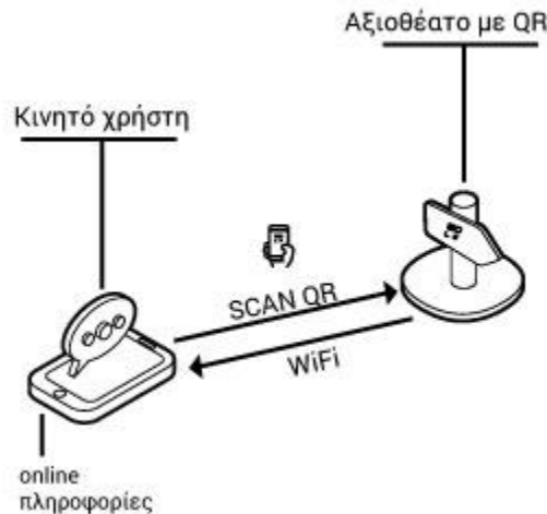
Εικόνα 2: Βασικό σενάριο χρήσης QR code